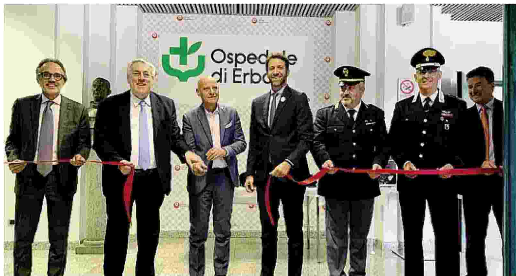
Il taglio del nastro con le autorità