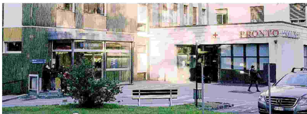
L'ingresso dell'ospedale erbese

Ritaglio stampa ad uso esclusivo del destinatario, non riproducibile.